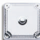
Modell KP VAP