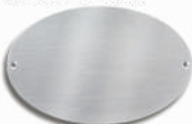
Modell OV4 VAM

Edelstahl matt oder poliert 150 x 95 x 2,0 mm