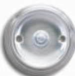
Modell K80 VAM