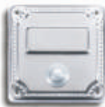
Modell KPG VAM