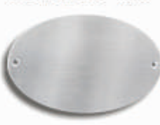
Modell OV3 VAM

Edelstahl matt oder poliert 122 x 79 x 1,5 mm