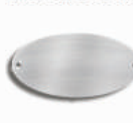
Modell OV5 VAM

Edelstahl matt oder poliert 104 x 53 x 4,0 mm